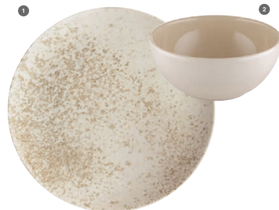
1 425776 Sandstone Beige 2 700561 Beige uni Preissp./price col. Basic Preissp./price col. Basic