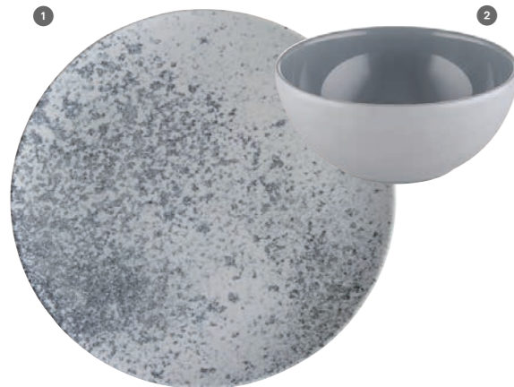
1 425774 Sandstone Gray 2 700562 Gray uni Preissp./price col. Basic Preissp./price col. Basic